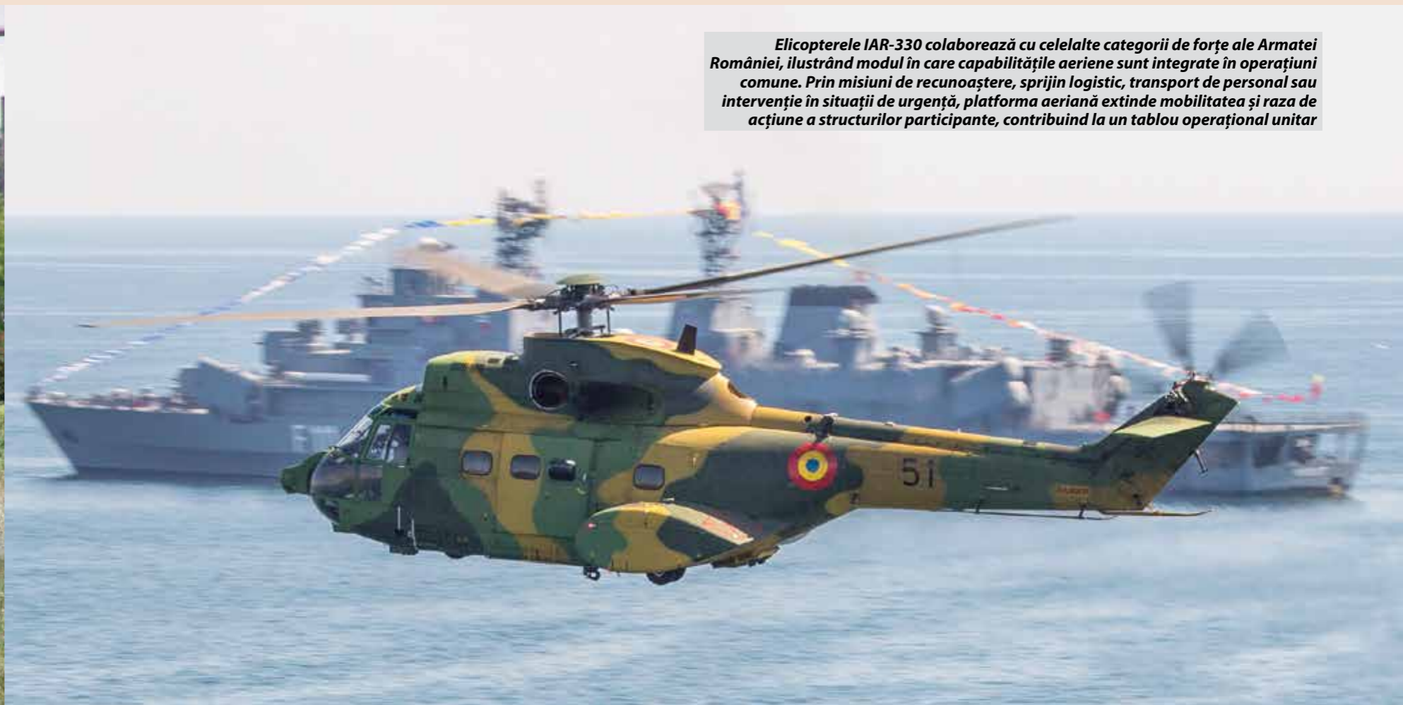
Elicopterele IAR-330 colaborează cu celelalte categorii de forțe ale Armatei României, ilustrând modul în care capacitățile aeriene sunt integrate în operațiuni comune. Prin misiuni de recunoaștere, sprijin logistic, transport de personal sau intervenție în situații de urgență, platforma aeriană extinde mobilitatea și raza de acțiune a structurilor participante, contribuind la un tablou operațional unitar