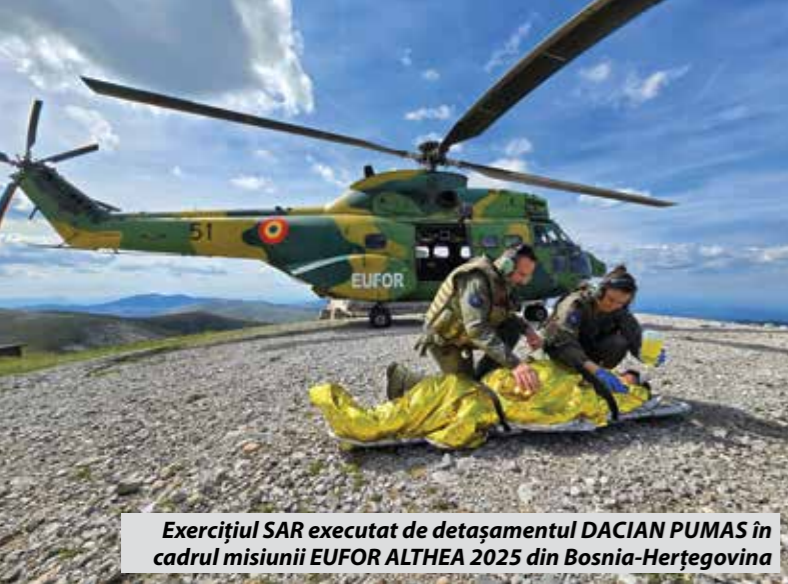
Exercițiul SAR executat de detașamentul DACIAN PUMAS în cadrul misiunii EUFOR ALTHEA 2025 din Bosnia-Herțegovina

fost semnat cu IAR S.A. Brașov, vizând transformarea elicopterelor IAR-330L în configurația IAR-330 L-RM.