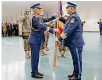
Prezent la activitate, șeful Statului Major al Forțelor Aeriene, general-locotenent Leonard-Gabriel Baraboi i-a mulțumit generalului de flotilă aeriană Ovidiu Bălan pentru dedicarea și profesionalismul de care a dat dovadă de-a lungul carierei