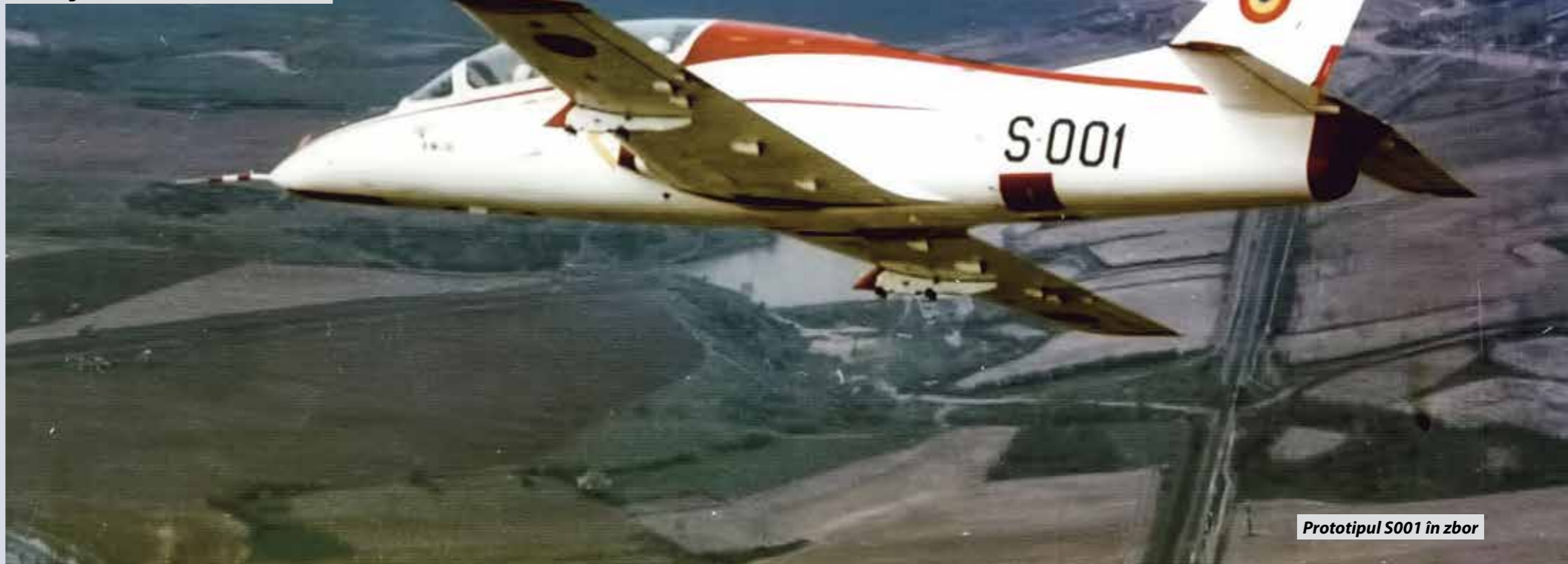
Prototipul S001 în zbor

IAR-99 ȘOIM. În total, dintre cele 28 de avioane construite, 21 mai erau operaționale în Forțele Aeriene Române înainte de demararea acestor programe de reînnoire.