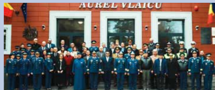
Dăruirea corpului didactic și a comandanților care au condus instituția de-a lungul timpului a fost răsplătită cu absolvenți eminenți și cu personalități marcante ale vieții tehnice românești, care s-au format în cadrul școlii

Ca om în primul rând, apoi ca subofițer de comandă al Statului Major al Forțelor