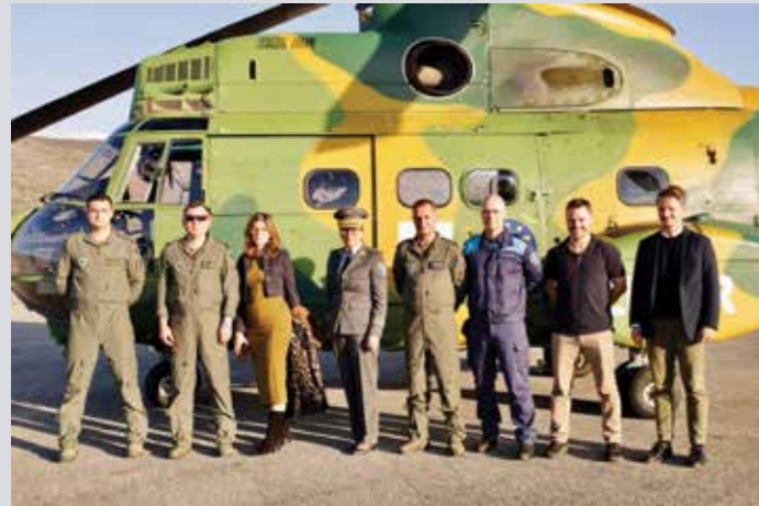
Detășamentul „Dacian Pumas” a executat misiunea de transport aerian a delegației Agenției Europene pentru Poliția de Frontieră și Garda de Coastă (FRONTEX), cu ocazia lansării primei operațiuni complete a Agenției în Bosnia și Herțegovina