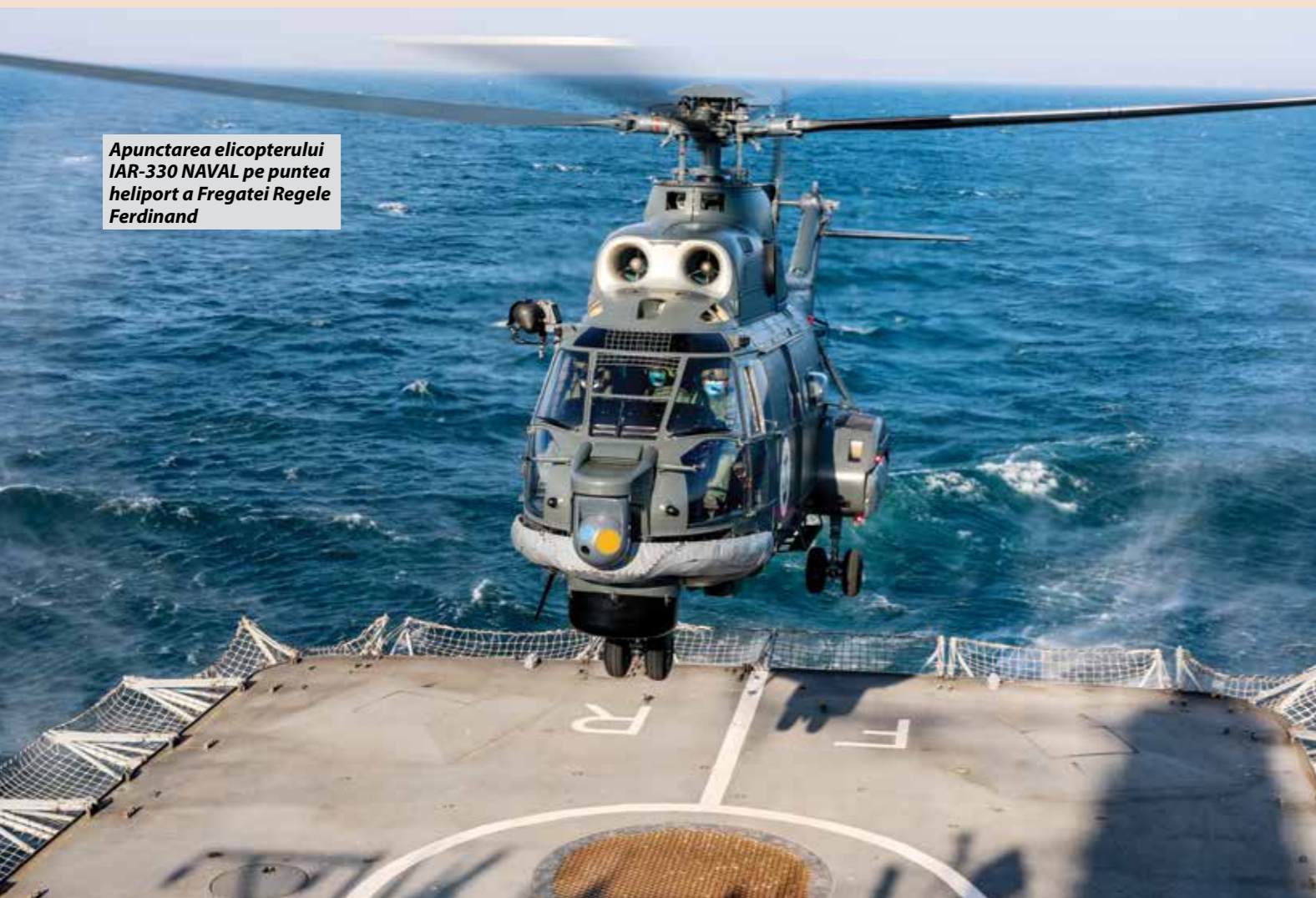
Apunctarea elicopterului IAR-330 NAVAL pe puntea heliport a Fregatei Regele Ferdinand

Începând cu 2019–2020, România a demarat un program amplu de revitalizare și modernizare a flotei IAR-330L Puma (transport/MEDEVAC). Modernizarea include multiple îmbunătățiri: sisteme de avionică moderne, senzori avansați, protecție suplimentară și capabilități de război electronic. Un contract major pentru această modernizare a