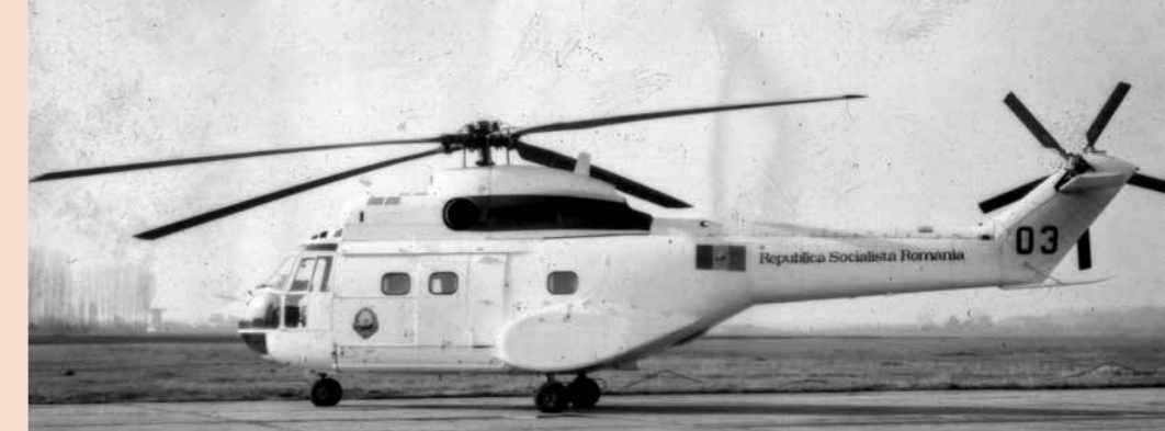
IAR-330 și-a demonstrat rapid valoarea operațională în sprijinul multiplelor proiecte naționale strategice. Misiunile sale au inclus sprijin logistic pentru construcția autostrăzii Transfăgărășan și a unor instalații hidroelectrice majore, intervenții în caz de dezastre și operațiuni de ajutor în caz de inundații în anii 1970, sprijin logistic maritim pentru platformele de foraj marin și asigurarea transportului aerian securizat pentru personalul guvernamental și militar