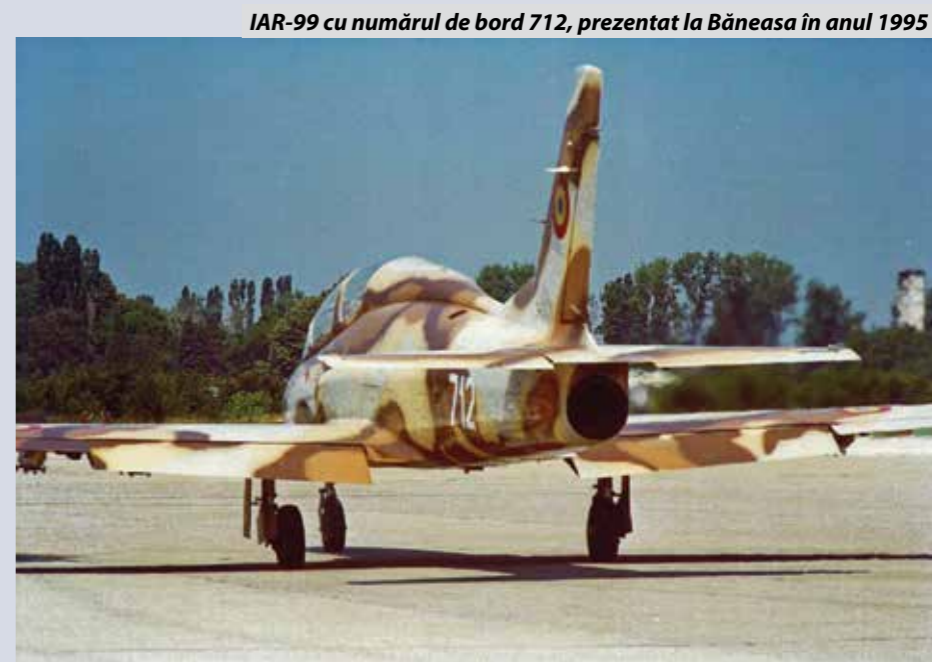
IAR-99 cu numărul de bord 712, prezentat la Băneasa în anul 1995

Text: Adrian Sultănoiu (articol realizat cu sprijinul specialiștilor de la Centrul de Cercetare Inovare și Încercări în Zbor)