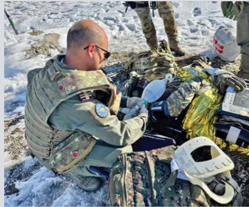
Premieră pentru „Dacian Pumas” – Primul exercițiu SAR în Camp Butmir! Militarii detașamentului „Dacian Pumas”, aflați în cea de-a III-a rotație în Teatrul de Operații Camp Butmir, au executat primul exercițiu de tip căutare-salvare (SAR - Search and Rescue) de la începutul misiunii - ianuarie 2025. Exercițiul, desfășurat în condiții dificile – la altitudini mari și temperaturi scăzute – a testat capacitatea echipajelor de acțiune rapid, eficient și coordonat în misiuni reale. Scenariul a inclus și o secvență de evacuare medicală (MEDEVAC - Medical Evacuation), în cadrul căreia militarii români au intervenit pentru evacuarea și transportul unei persoane rănite dintr-o zonă greu accesibilă. Prin aceste antrenamente, „Dacian Pumas” demonstrează profesionalism, curaj și spirit de echipă, consolidând contribuția României la menținerea stabilității și siguranței în Bosnia și Herțegovina. „Dacian Pumas” – mereu acolo unde viața are nevoie de aripi!