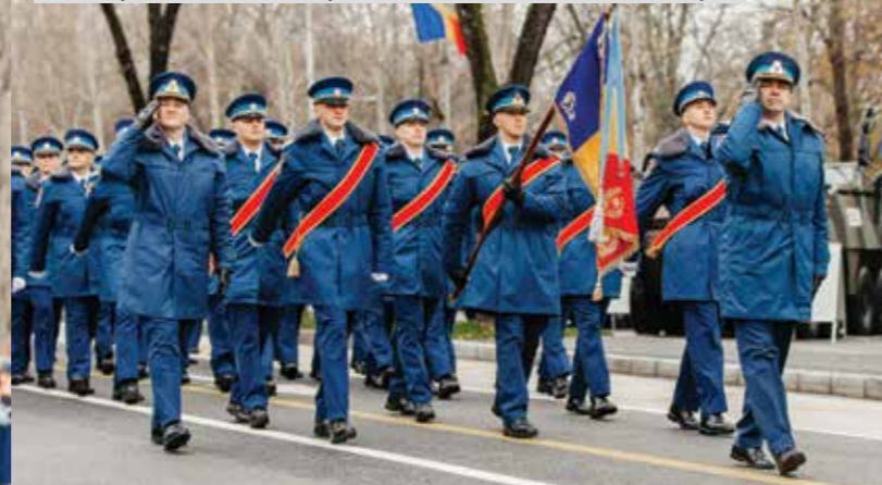
Elevii ai Colegiului Național Militar „Mihai Viteazul” din Alba Iulia