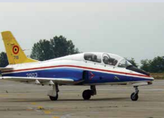
Prototipul S-003, reinmatriculat 7003, a fost transformat în demonstratorul IAR-109 "Swift"; imagine de la RoIAS 2006