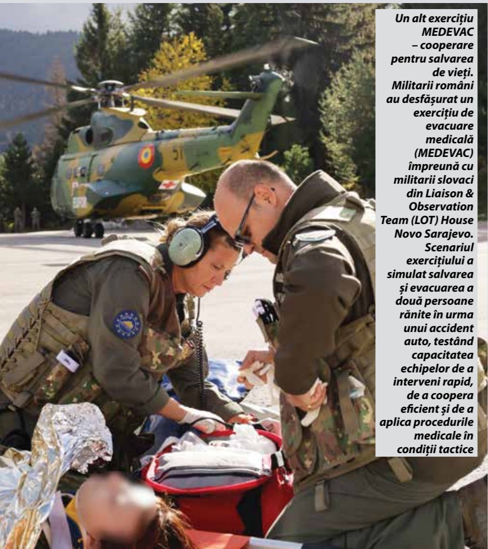
Un alt exercițiu MEDEVAC – cooperare pentru salvarea de vieți. Militarii români au desfășurat un exercițiu de evacuare medicală (MEDEVAC) împreună cu militarii slovaci din Liaison & Observation Team (LOT) House Novo Sarajevo. Scenariul exercițiului a simulat salvarea și evacuarea a două persoane rănite în urma unui accident auto, testând capacitatea echipelor de a interveni rapid, de a coopera eficient și de a aplica procedurile medicale în condiții tactice