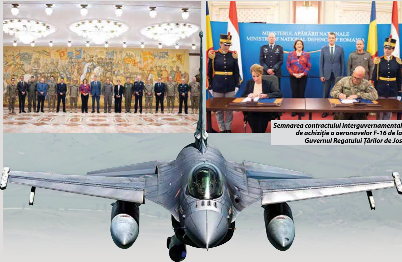
Semnarea contractului interguvernamental de achiziție a aeronavelor F-16 de la Guvernul Regatului Țărilor de Jos