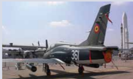
Alături de racheta franceză Arianne, IAR-99 ȘOIM cu numărul de expoziție 361, la Salonul Aeronautic de la Le Bourget în anul 1999