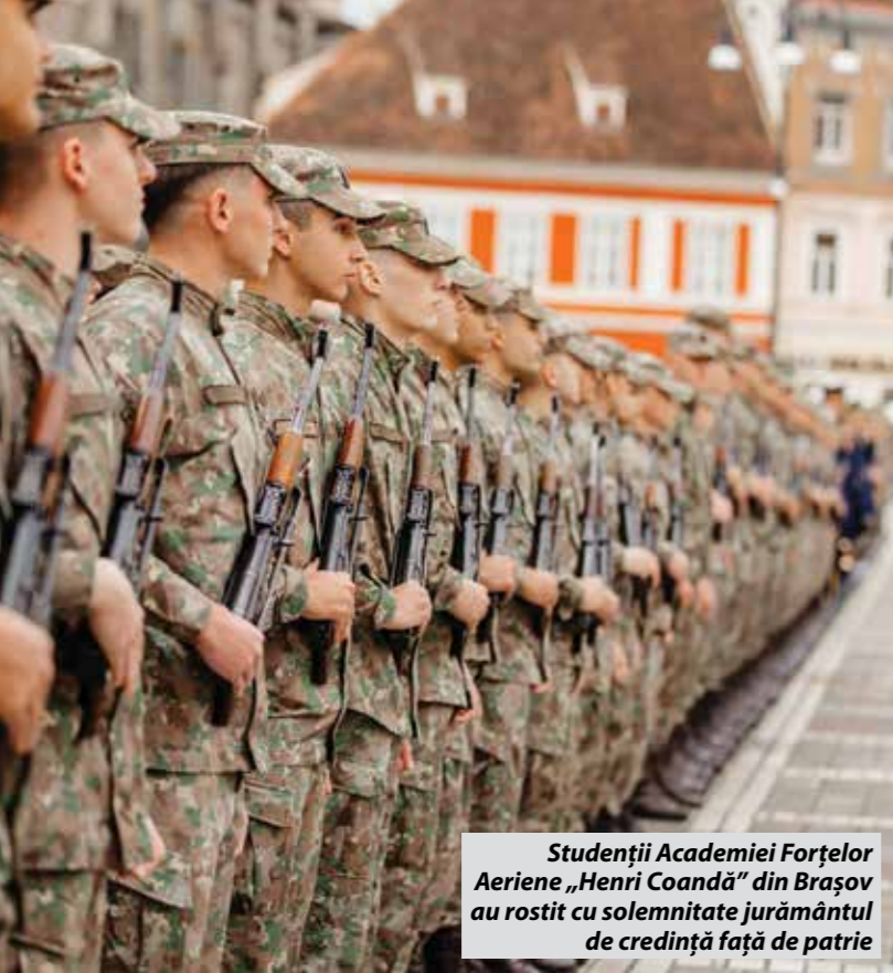
Studentii Academiei Forțelor Aeriene „Henri Coandă” din Brașov au rostit cu solemnitate jurământul de credință față de patrie