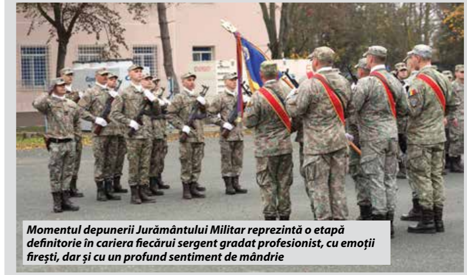
Momentul depunerii Jurământului Militar reprezintă o etapă definitorie în cariera fiecărui sergent gradat profesionist, cu emoții firești, dar și cu un profund sentiment de mândrie