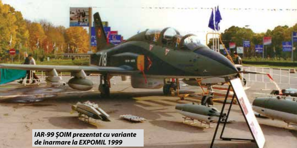
IAR-99 ȘOIM prezentat cu variante de înarmare la EXPOMIL 1999