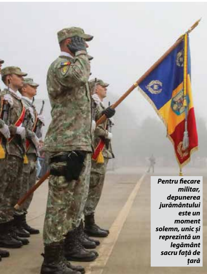
Pentru fiecare militar, depunerea jurământului este un moment solemn, unic și reprezintă un legământ sacru față de țară

Prin aceste ceremonii solemne, fiecare tânăr militar își încheie perioada de instruire și intră într-un nou capitol al carierei sale, întărind legătura Forțelor Aeriene Române cu valorile fundamentale ale națiunii. Jurământul Militar rămâne un legământ sacru și etern al devotamentului față de țară, în care vocile noilor recruți se unesc în credința lor față de România.