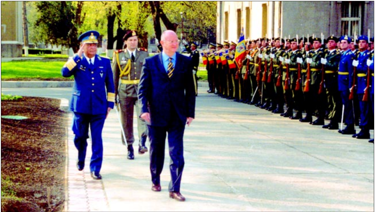
Ministrul Apărării Naționale, Ioan Mircea Pașcu, a participat la bilanțul Statului Major al Forțelor Aeriene

Fete în uniformă, la cursul de subofitieri