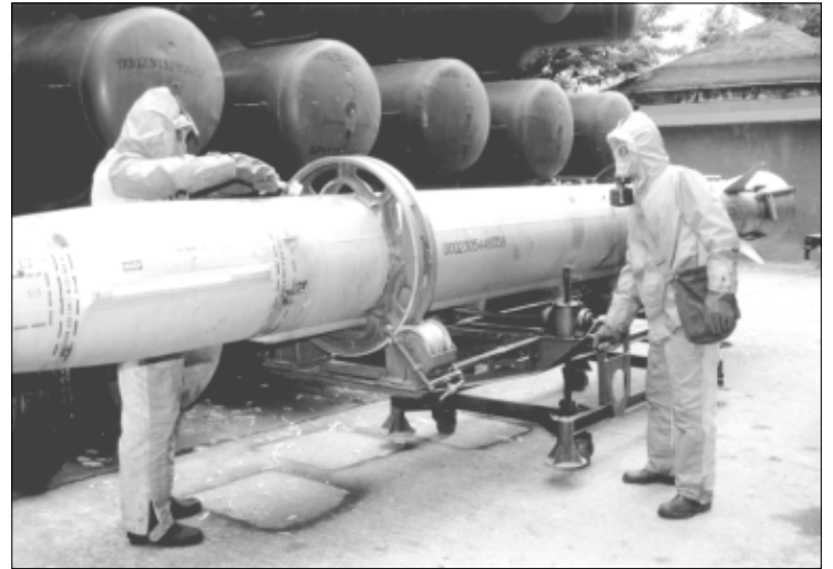
Cu oxidantul nu-i de glumă; alimentarea, golirea și neutralizarea rezervorului necesită atenție maximă din partea servanților și multă, multă îndemânare