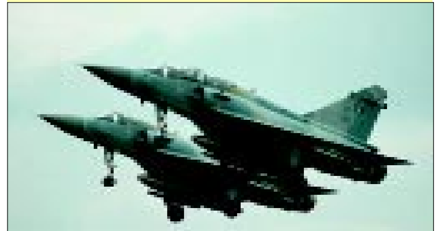
Formație franceză de "Rafale", scrutând "taberele" pacificate