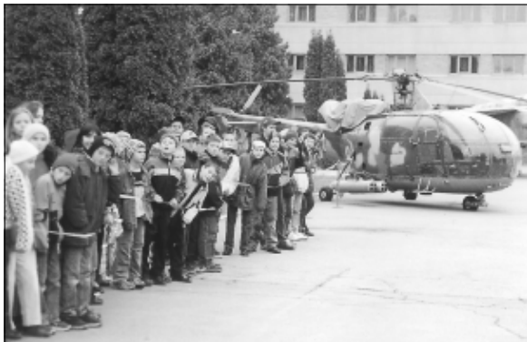
Astăzi – invitați, mâine – studenți merituoși ai Academiei Forțelor Aeriene