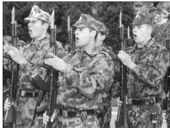
„Jur să-mi apăr țara chiar cu prețul vieții”

Disciplinele pe care studenții le parcurg în cei patru ani de pregătire sunt, după caz, obligatorii, facultative sau opționale și sunt grupate în patru module: pregătirea militară de bază, disciplinele fundamentale, disciplinele de profil și specialitate și disciplinele complementare. Pregătirea militară de