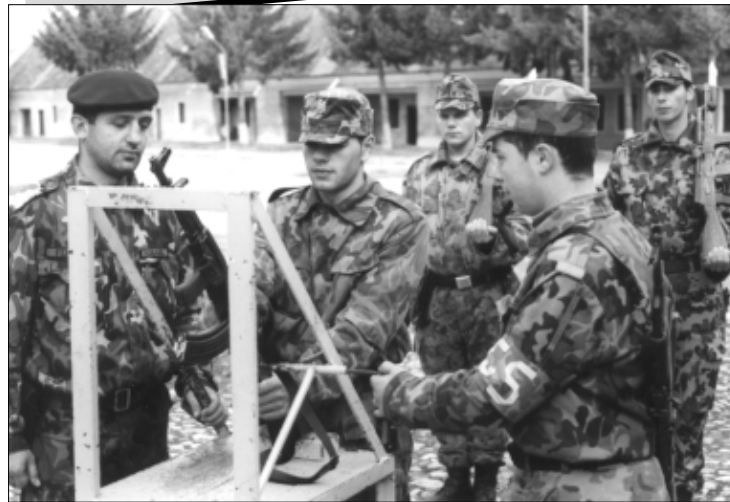
Încărcarea pistolului mitralieră, sub privirea vigilentă a comandantului pazei

O nouă serie de militari în termen a finalizat, de curând, stagiul de pregătire de bază efectuat în cadrul batalionului de instrucție al Școlii de Aplicație pentru Aviație. În prezent, acești tineri își desfășoară deja activitatea în unități din structura Statului Major al Forțelor Aeriene. Printre unitățile beneficiare se numără și Depozitul de materiale tehnice al cărui comandant este locotenent-colonelul Octavian Secheli, în incinta căruia ne-am aflat în documentare zilele trecute.