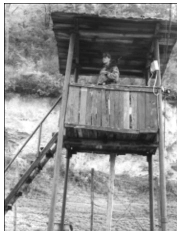
De sus, din foisor, lucrurile se văd întotdeauna mai bine

s-au scurs până la venirea poliției, am încercat să aflăm de la el ce i-a venit, de a sărit gardul unității. Din pozițiile lipsite de orice noimă pe care le rostea, am înțeles numai atât: <<...un foc...>>. Probabil, însă, că nu un foc de armă își dorea...”