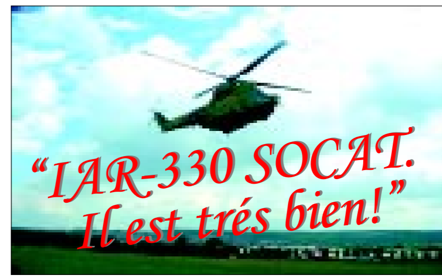
În misiune de evacuare-salvare, IAR-330 PUMA SOCAT

Cele două elicoptere românești nu au acționat amândouă, în formație. Erau, de regulă, cap în formații cu alte trei-cinci aparate de tipuri diferite. După cum ne spunea locotenent-comandorul Suciu, s-a depășit stadiul în care erau testați. Capacitățile dovedite în decursul atâtor aplicații i-au "promovat" în echipe, s-a lucrat tot timpul pe subunități formate din reprezentanți ai mai multor state, stii NATO, în care răspunderea, contribuția partici-