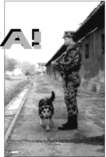
Concurență mare: două santinelle, un singur post de pază

însoțit de unul dintre militarii aflați <<la veghe>> în momentul acela. Am fugit cât am putut de repede, fiindu-mi teamă să nu ajung prea târziu... Santinela sunase imediat ce a sesizat intenția necunoscutului de a pătrunde în incinta unității. Când am ajuns noi la fața locului, intrusul începuse deja să urce treptele foisorului, ignorând somațiile santineli. <<Nu trage!>> – am strigat din răsuferi. <<Sunt eu, comandantul pazei! Suntem aici!>> Din fericire, soldatul și-a păstrat sângele rece și nu a făcut uz de armamentul din dotare. În schimb, <<musafirul>> nepoftit, auzindu-ne, a rupt-o la fugă. L-am prins repede. L-am imobilizat și l-am escortat până la camera de oaspeți. Era beat. În cele zece minute care