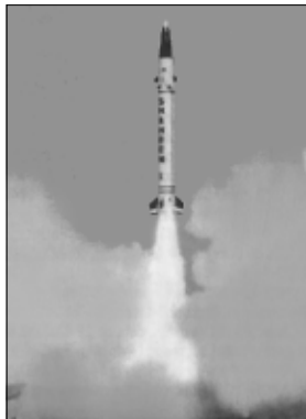
Racheta "HATF IV- Shaheen 1"

SHAHEEN 1", de producție proprie, capabilă să transporte atât muniții convenționale, cât și focose nucleare. Drept răspuns, Forțele Aeriene ale Indiei au efectuat un test cu o