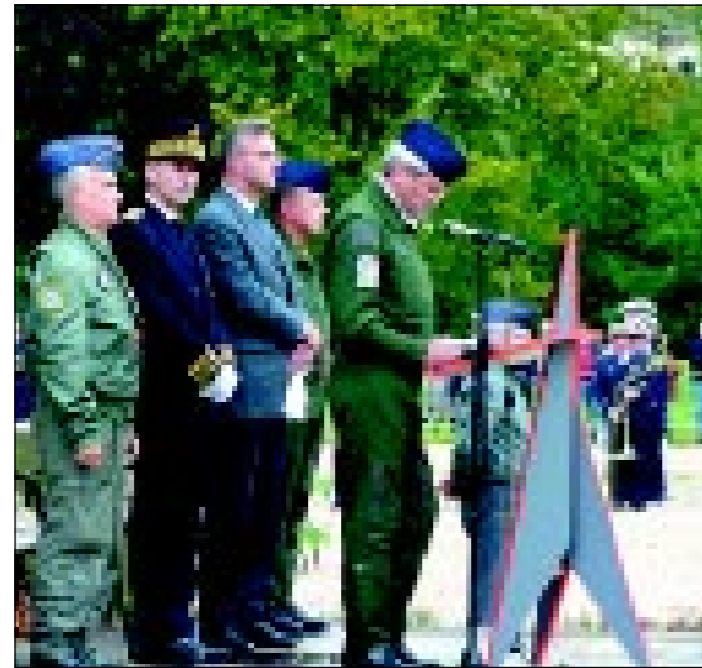
Secvențe oficiale de la cea de-a șasea ediție a exercițiului multinațional real "Cooperative Key 2002" – Saint-Dizier, Franța

Detasamentul aerian român participant la exercițiul "Cooperative Key 2002" a fost comandat