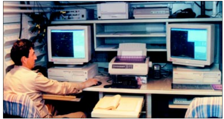
Aparatură complexă, modernă pentru noile concepte, noile proceduri de gestionare a spațiului aerian

rămânând structura care generează forțele. În viitor, în urma revizuirii unor eșaloane, Comandamentul va lua în subordine operativă unitățile și marile unități din toate armele ce compun categoria de forțe armate. O trecere graduală în care Comandamentul va monitoriza și nivelul pregătirii. De la serviciul de poliție aeriană, remarcăm o trecere treptată spre complexitatea funcțiilor și atribuțiilor ce le presupune, în integritate, suveranitatea aeriană națională. Statul major al Comandamentului are, de pildă, un compartiment care permite colectarea tuturor datelor și informațiilor de cercetare, procurate prin diverse surse, pe care le prelucrează și analizează, asigurând celorlalte compartimente datele necesare planificării acțiunilor. Un alt compartiment realizează planificarea și coordonarea executării operațiilor aeriene în strânsă colaborare cu Centrul de operații.