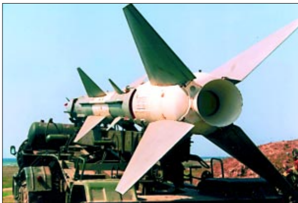
Spre poziția de tragere

Linia din Poligonul Capu Midia este "spartă" de zgomotul motoarelor elicopterului IAR-330, care decolează îndreptându-se către mare, având ca misiune cercetarea aeriană și maritimă a sectorului de tragere, precum și verificarea orientării rampei de lansare a rachetelor țintă, situate pe platforma maritimă GABARA. Măsurile de siguranță sunt completate de un dispozitiv de securitate asigurat de opt nave aparținând Fortelor Navale. Întrucât de dimineață, gradul de agitație al mării a fost crescut, instalarea platformei de lansare este întârziată. Ca urmare, "micul război" va fi declanșat de