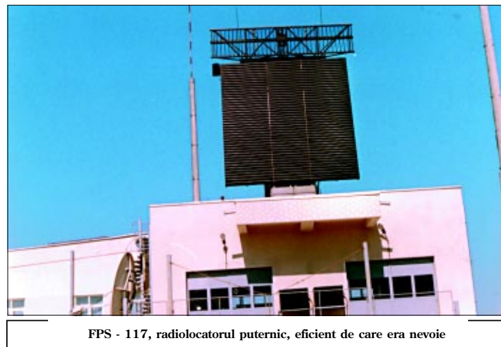
FPS - 117, radiolocatorul puternic, eficient de care era nevoie

În prezent, Comandamentul are toate structurile care îi permit să planifice, organizeze și să conducă execuția operațiilor aeriene fără a mai fi implicate și alte componente, Statul Major al Forțelor Aeriene