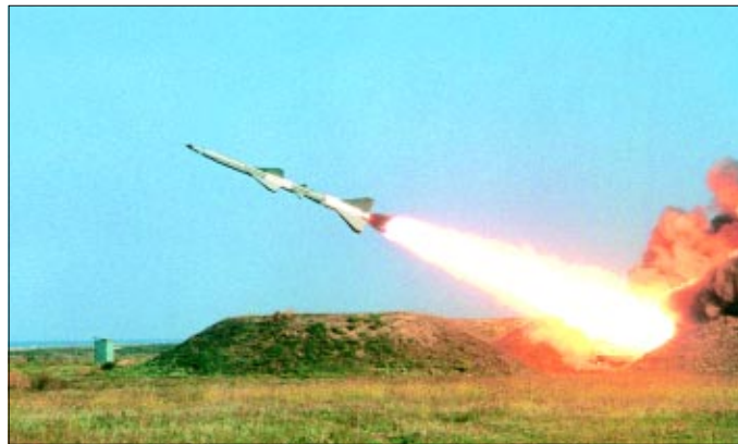
Cale fără întoarcere

"Micul război" a durat două ore. Poate părea puțin, dar pentru acesta artileriștii și rachetiștii antiaerieni s-au pregătit un an de zile.