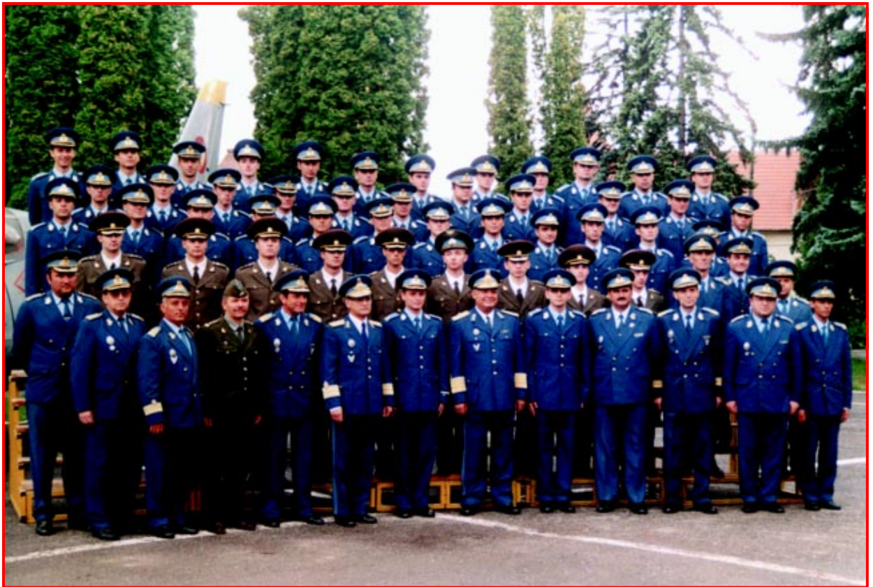
FOTO DOCUMENT: ofițerii din promoția 2002 a Academiei Forțelor Aeriene "Henri Coandă" s-au fotografiat cu o parte dintre lectorii și instructorii lor de zbor, cu comandantul instituției absolvite și cu șeful Statului Major al Forțelor Aeriene

PUTEREA AERIANĂ – realitate și perspectivă la începutul Mileniului III